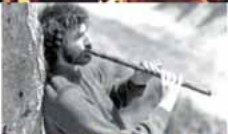
Duo Saz Peloul